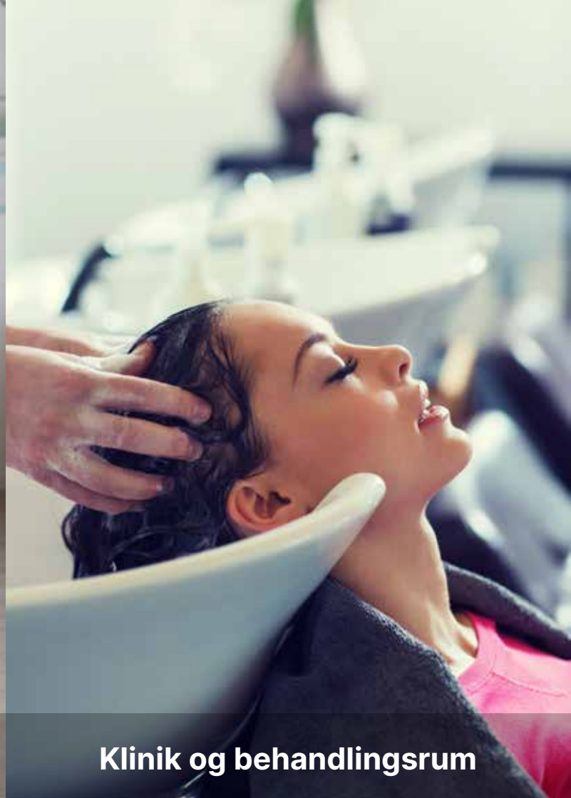
Klinik og behandlingsrum