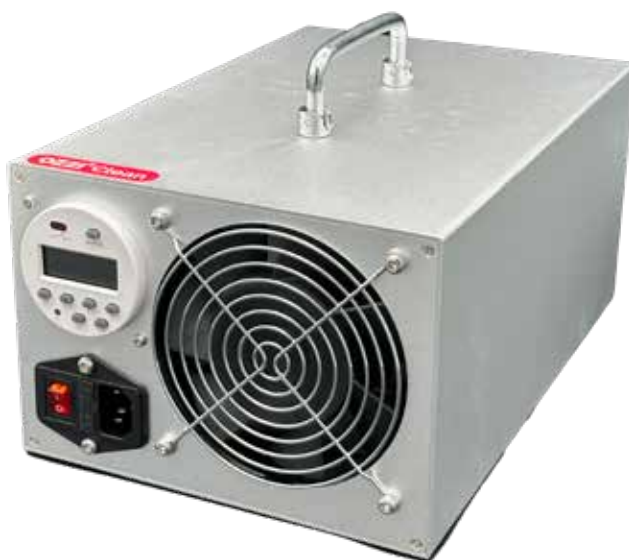
Timer og luftindsugning